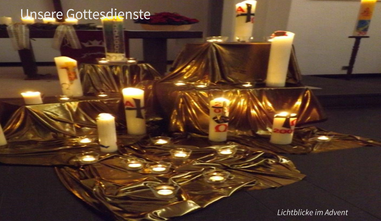
Lichtblicke im Advent