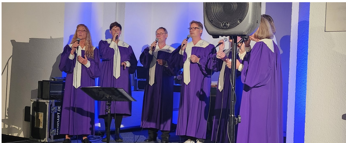
Auftakt zum Festwochenende: Gospel-Konzert mit Just Gospel aus Dortmund